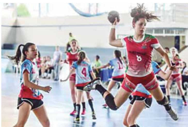
O handebol tem apresentado um nível bastante elevado nos Jogos