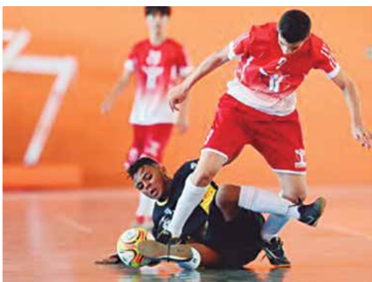
No futsal, a equipe da Paraíba tem boas chances de subir ao pódio