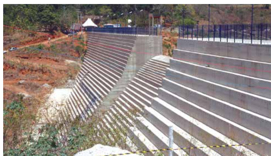
Barragem Nova Camará vai beneficiar população em 20 cidades paraibanas