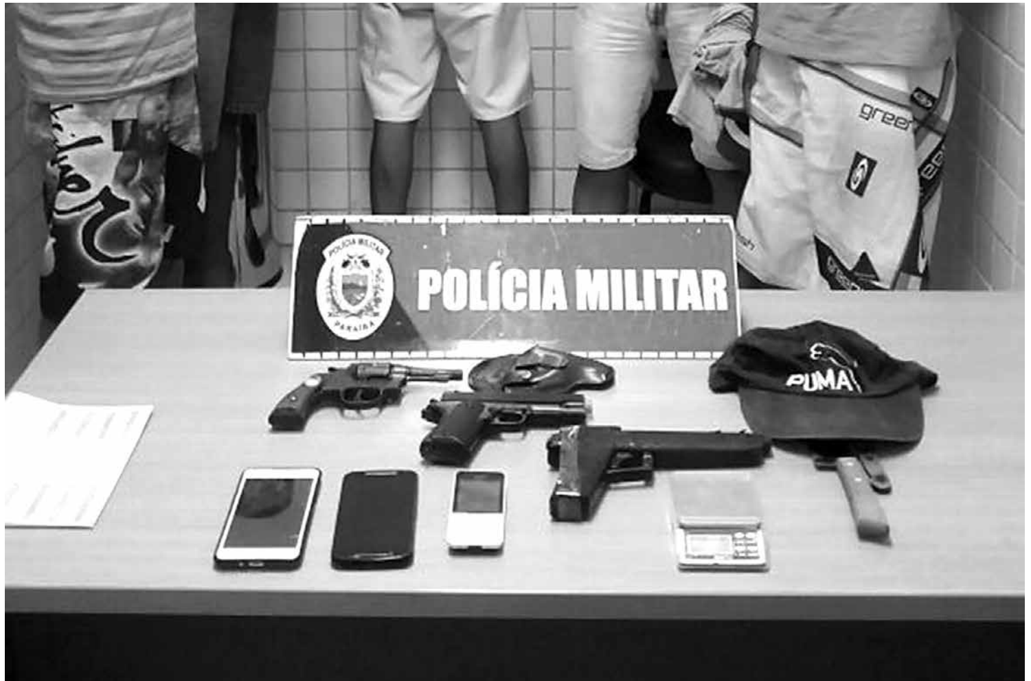
Com os criminosos, a Polícia Militar conseguiu apreender um revólver, dois simulacros de pistola e boa parte do material roubado

De acordo com o tenente Bertuni Silva, desde o momento do roubo, a PM realizou diligências para chegar até os autores do crime