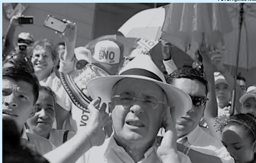
Ex-presidente Uribe liderou protestos ontem contra o acordo assinado pelo atual presidente

A Nasa estima que essas nuvens atinjam 200 quilômetros de altura antes de "chover" na superfície da Europa - a Lua de Júpiter tem um enorme oceano com o dobro de água da Terra protegido por uma camada de gelo duro e com espessura desconhecida. Em 15 meses, a equipe do Hubble observou erupções em três ocasiões.