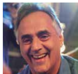
Luciano Cartaxo (PSD)

6h - Adesivagem e panfletagem 8h - Reunião com a coordenação de campanha 8h40 - Caminhada no Geisel 11h - Entrevista de Wilson Filho 16h40 - Caminhada no Bairro dos Novais 17h40 - Reunião na comunidade Mumbaba 18h40 - Caminhada no Rangel 22h - Debate na TV Tambaú