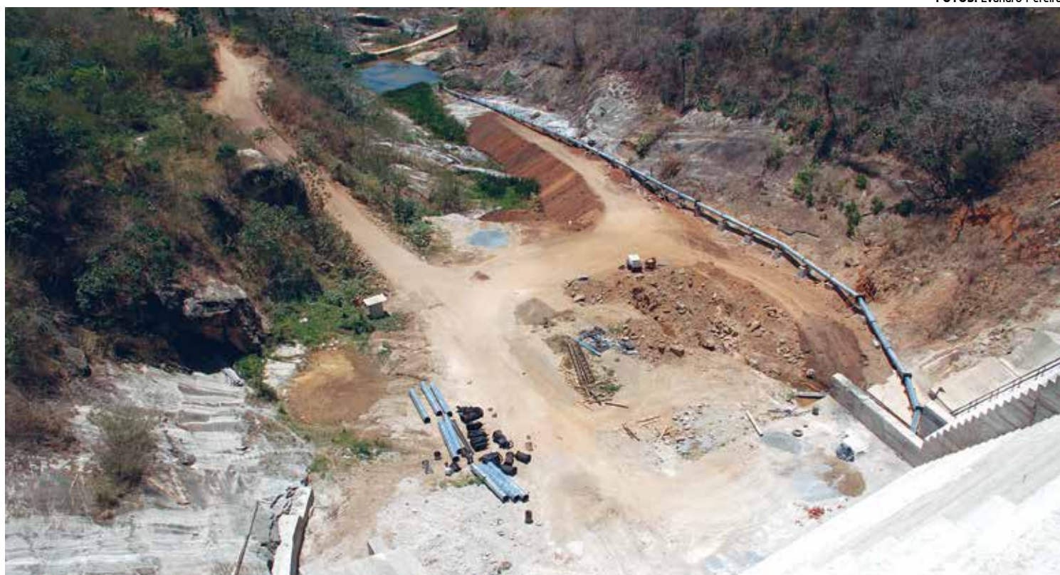
Obra é considerada a redenção para a região; em 2004, com o rompimento, 800 famílias ficaram desabrigadas e quatro pessoas morreram

Camará começou a ser reconstruída em 2012 e tem capacidade para acumular 26 milhões de metros cúbicos de água