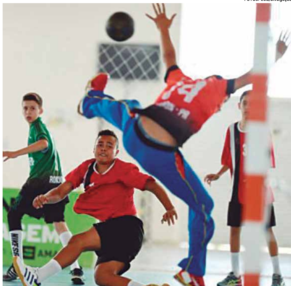
As modalidades coletivas programam vários jogos para esta terça-feira nos Jogos Escolares

“Temos chances de classificação. Todas estão motivadas e acreditamos que dá para ficar entre as duas melhores colocadas da nossa chave. O apoio da torcida