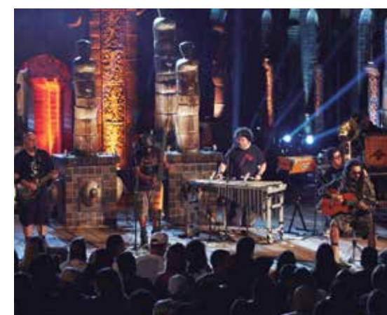
Banda vai apresentar o primeiro eletroacústico

Para conferir tudo isso de perto, os ingressos já estão à venda nas bilheteiras da Domus Hall e no site Ingresso Rápido. As entradas custam R$ 40 meia entrada, R$ 80 inteira, R$ 85 camarote frontstage e R$ 1400 camarote privê para 10 pessoas.