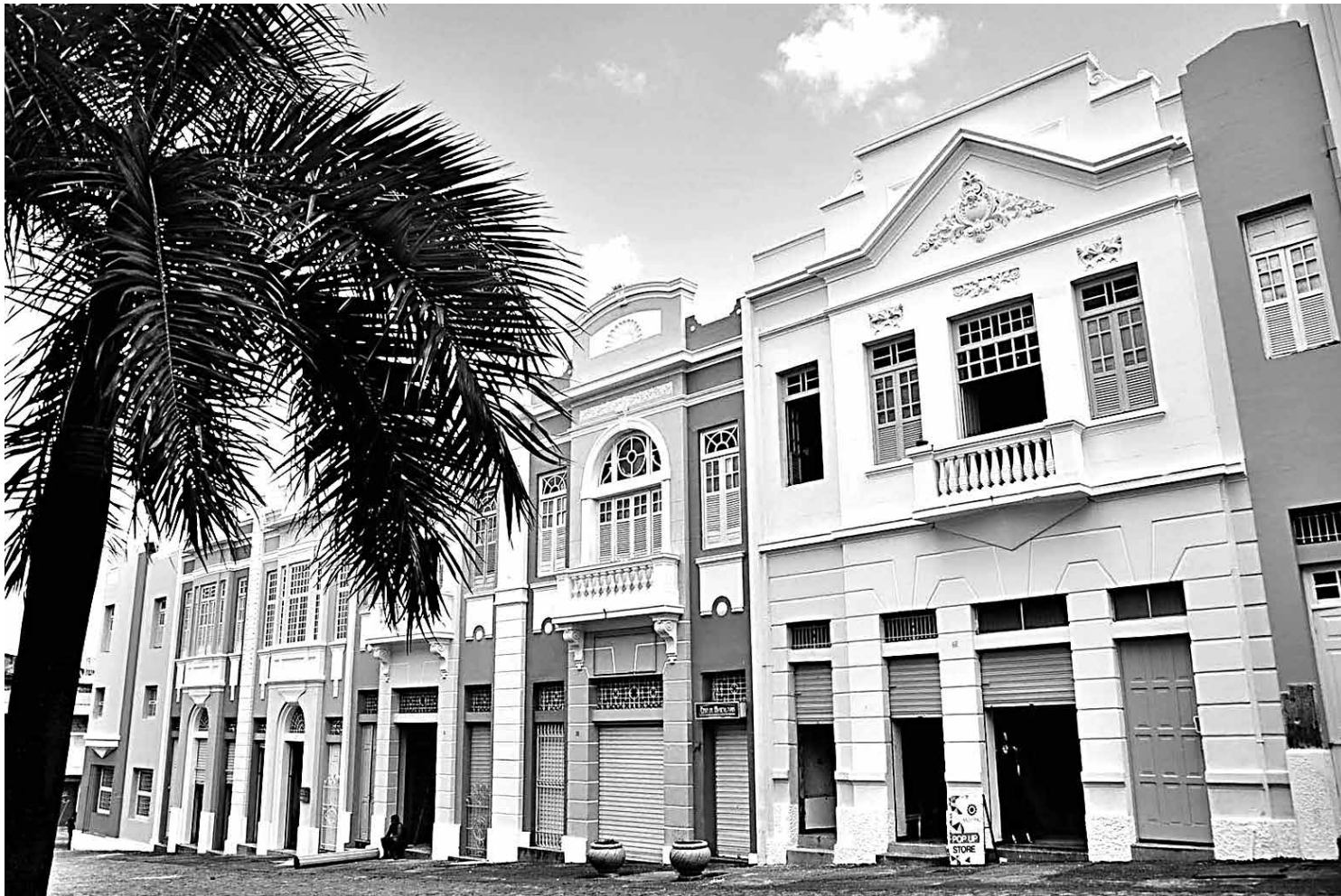
Centro Histórico da capital fez parte de um city-tour com grupo de 13 agentes de viagens; praias também se inserem no roteiro

O estudo da demografia das empresas do IBGE permite analisar as taxas de entrada, saída e sobrevivência, além da mobilidade e idade média das empresas. A Demografia das Empresas 2014 incluiu somente as unidades ativas das empresas com endereço de atuação no Brasil e com fundação até 31 de dezembro de 2014. Em virtude da não obrigatoriedade de preenchimento dos registros administrativos do Ministério do Trabalho, os Microempreendedores Individuais (MEI) são desconsiderados das estatísticas desta publicação.