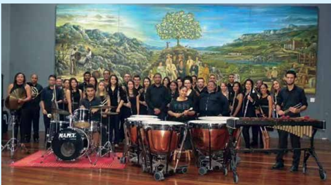
A Banda Sinfônica José Siqueira (foto) vai receber a Banda Marcial da Escola Papa Paulo VI