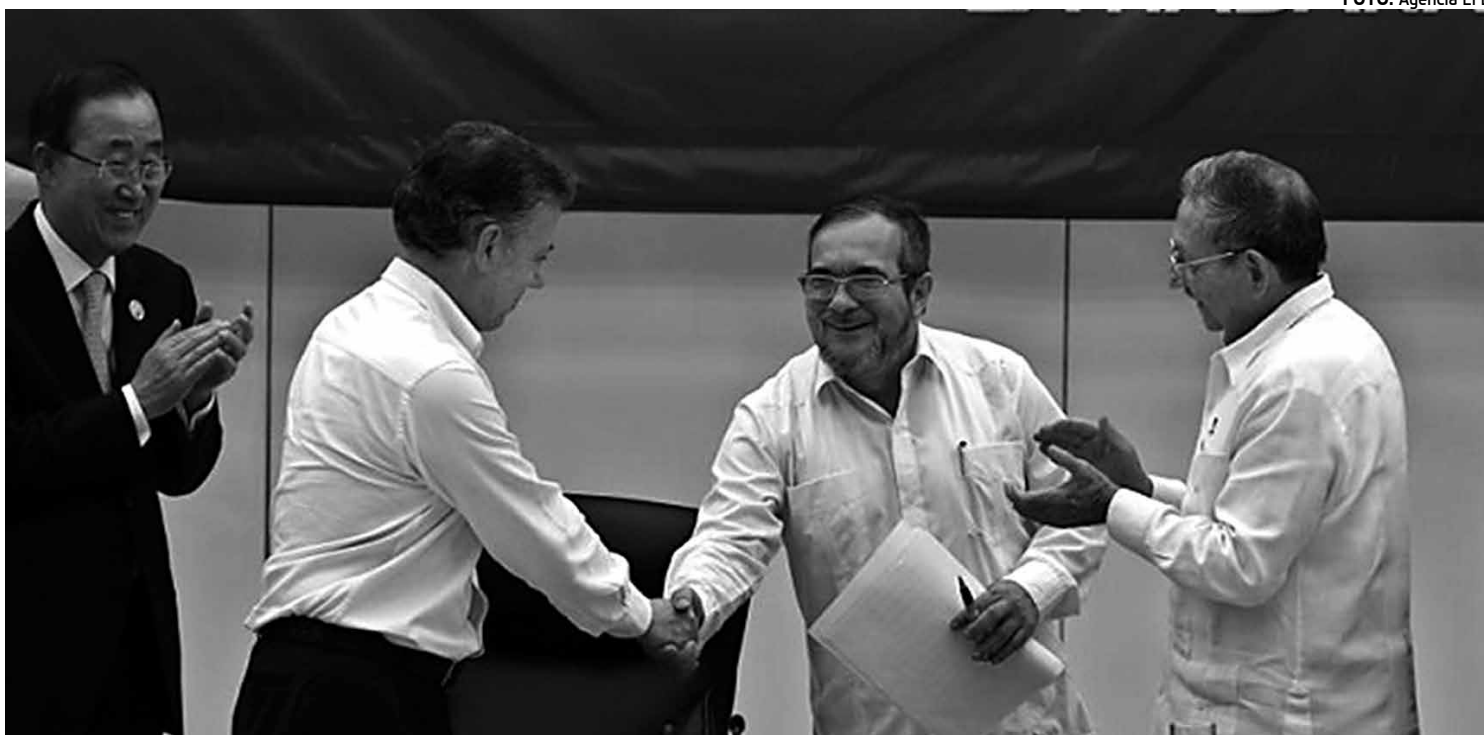
Secretário Geral da ONU (E), o presidente da Colômbia Juan Manuel, o líder das Farc Rodrigo Londoño Echeverri e o presidente cubano (D)

O acordo foi aprovado por unanimidade durante a 10ª Conferência Nacional das Farc, realizada pela última vez de forma ilegal. "Informamos que os guerrilheiros-delegados deram respaldo unânime ao acordo