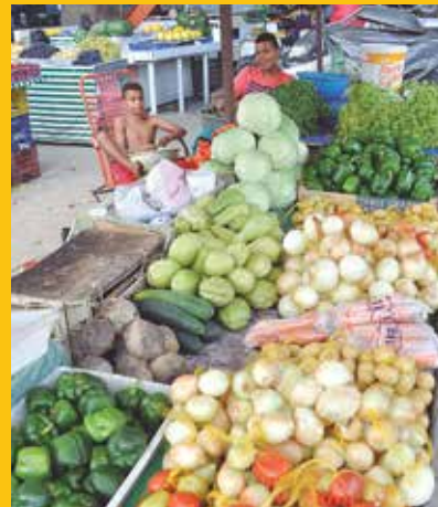
Feirantes reclamam das vendas