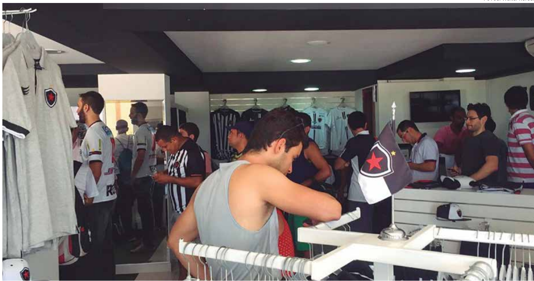
Uma imensa fila se formou ontem na loja do clube em busca do ingresso para o primeiro jogo decisivo contra o Boa Esporte que vai acontecer na próxima sexta-feira

Nesta terça-feira, o Belo volta a treinar, mas apenas no período da manhã. O time fará um treino técnico-tático, a partir das 9 horas, no Centro de Treinamento da Maravilha do Contorno. Amanhã, o técnico Itamar Schulle vai comandar um treino coletivo de portões fechados no Almeidão. A atividade está programada para às 9h30.